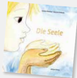
„Die Seele“, ein meditatives Buch für Kinder und Erwachsene.