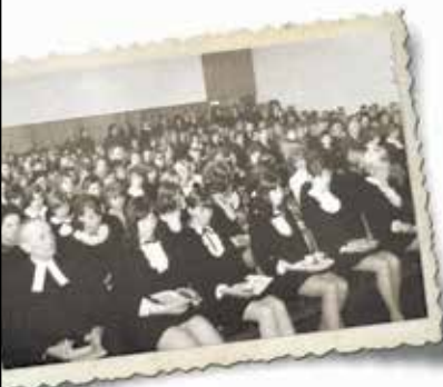
Unsere Gemeinde am Sonntag, den 3. März 1968 bei der Einsegnung