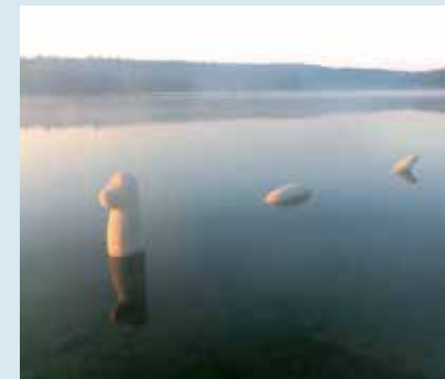
„Stocki“, der Glücksbringer von Stock-Ness!