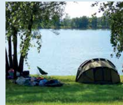
Der schöne kleine Campingplatz liegt direkt am Stocksee, zwischen Plön und Bad Segeberg.