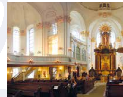
Der Innenraum der Hamburger Hauptkirche St. Michaelis (Michel).

Mit der Korrepetitions-klasse des Hamburger Konservatoriums: „Das Volk, das im Finstern wandelt, sieht ein großes Licht...“ Am Freitag, 11. Dez. um 18:00 Uhr laden wir Sie ganz herzlich ein in die MARIA-MAGDALENA-KIRCHE zu adventlicher Musik mit und ohne Gesang und besinnlichen Lesungen.