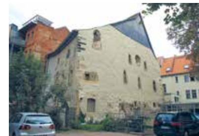
Alte Synagoge in Erfurt